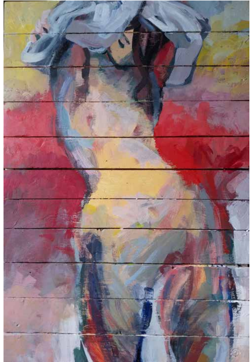
Charlotte, 2023, acrylique sur bois, 120 x 80 cm, 5 000 €