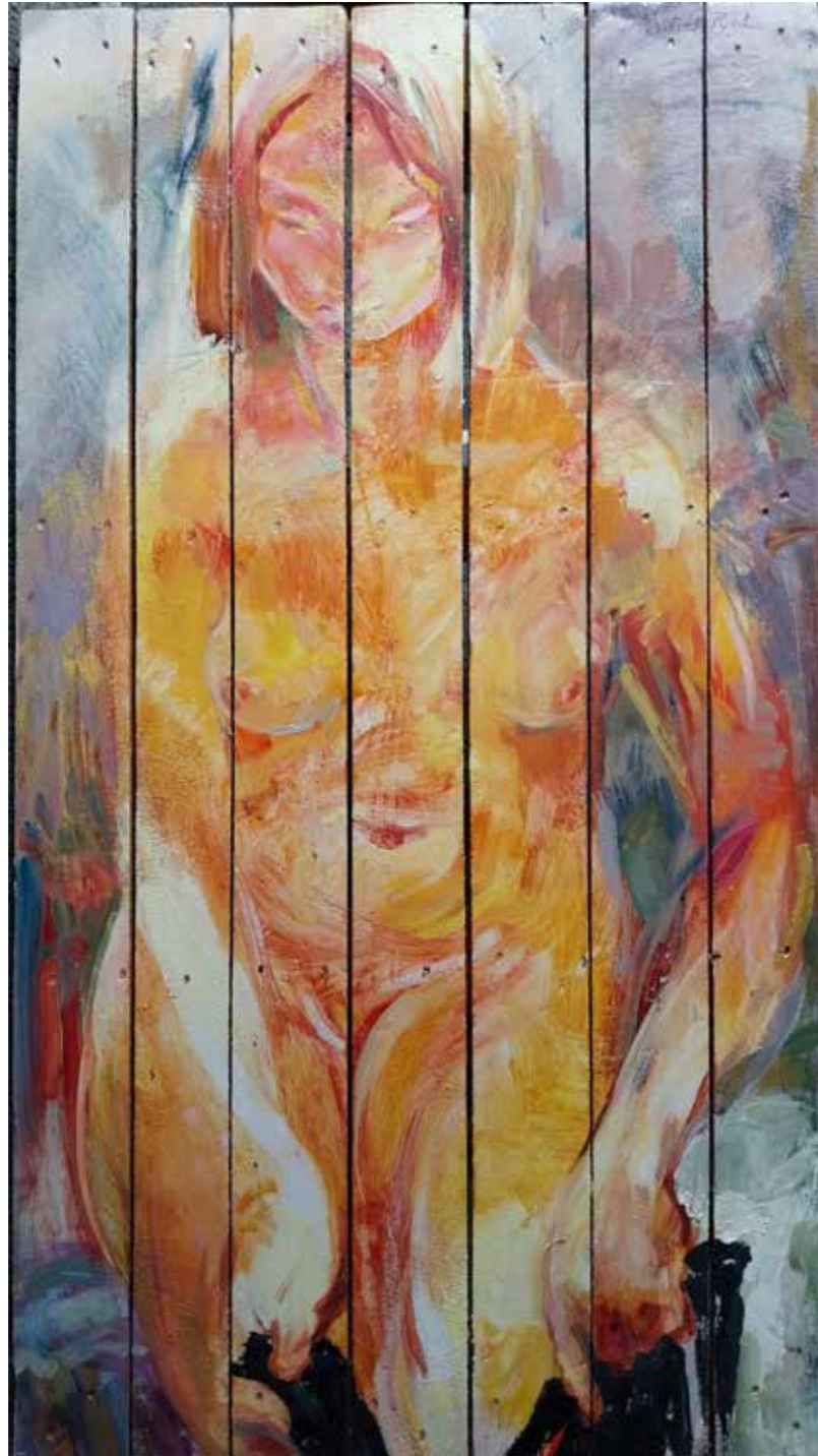
Mme Soleil, 1999, huile sur bois, 120 x 67 cm, Réservé