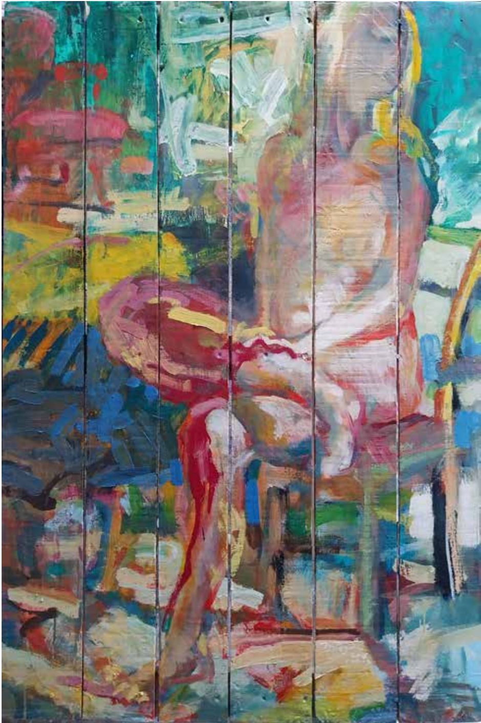
Nonchalante, 2015, huile sur bois, 120 x 80 cm, 5 000 €