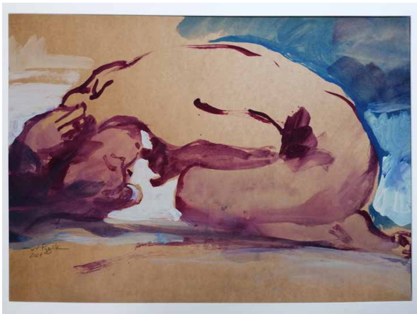
La mer se retire, 2021, acrylique sur papier kraft, 50 x 70 cm, 1 800 €