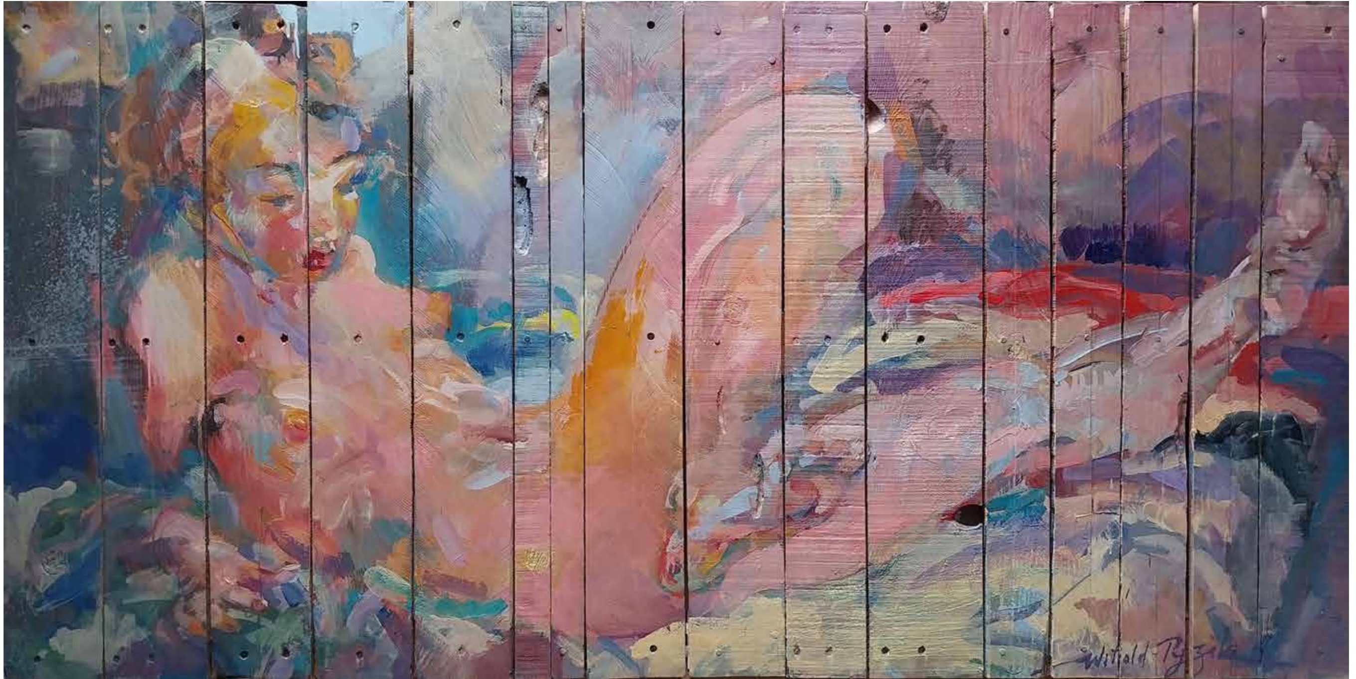
Amour fardé , 2005, huile sur bois, 80 x 160 cm, 8 000 €