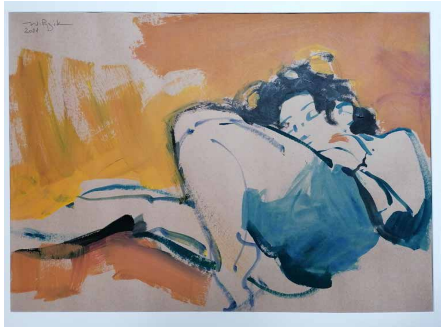
Agnieszka assoupie, 2021, acrylique sur papier kraft, 50 x 70 cm, 1 800 € Réservé