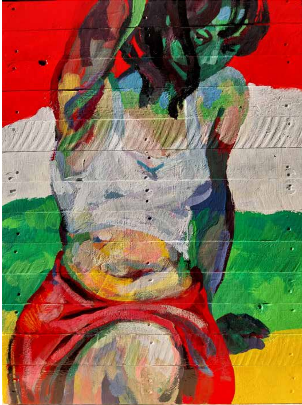
Forza, 2023, huile sur bois, 97 x 74 cm, Réservé