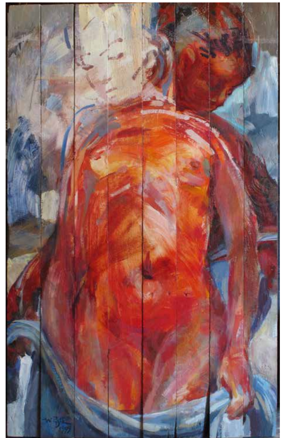
Servante, 1999, huile sur bois, 120 x 74 cm, 5 000 €