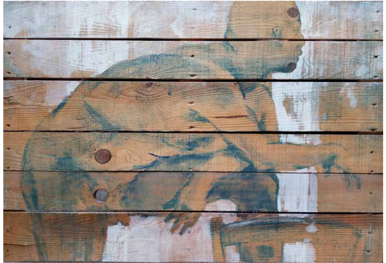
Fabrizio, 2015, encre et huile sur bois, 80 x 120 cm, 5 000 €