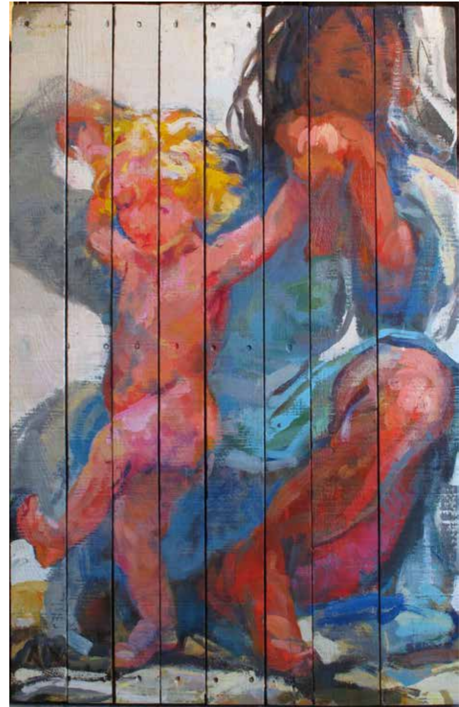
Premiers pas, 2015, huile sur bois, 120 x 80 cm, 5 000 €