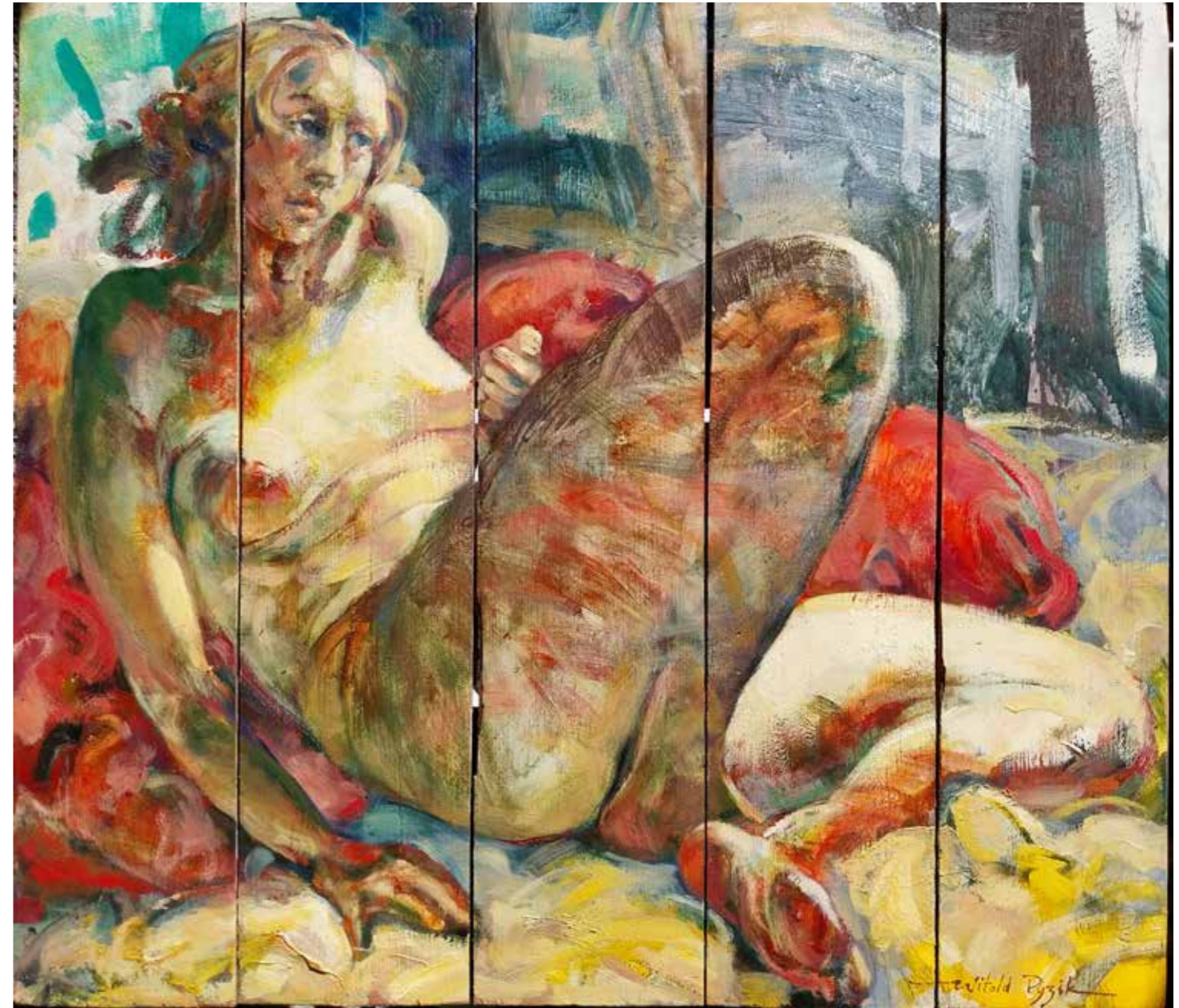
Un peu absente, 2005, huile sur bois, 99 x 113 cm, 6 000 €