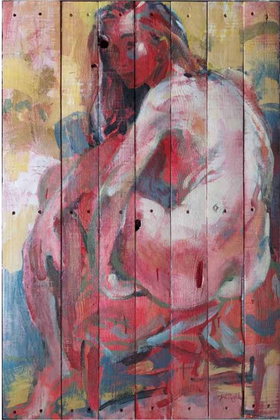
Élise, 2006, huile sur bois, 120 x 80 cm, 5000 € Réservé