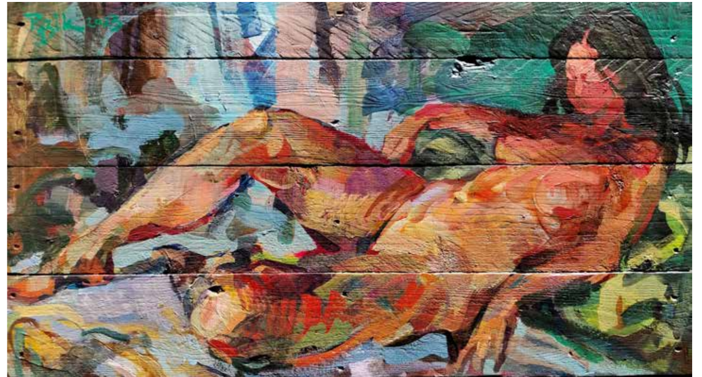
89,6° Fahrenheit, 2023, acrylique sur bois, 44 x 80 cm, Réservé