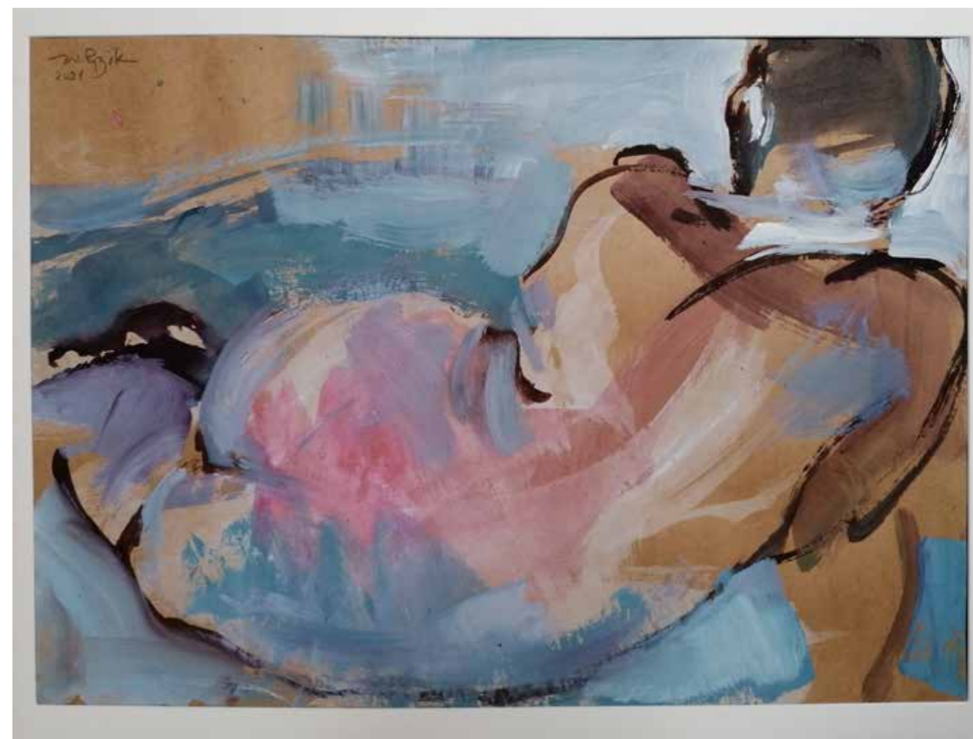
Ocean, 2021, acrylique sur papier kraft, 50 x 70 cm, 1 800 €