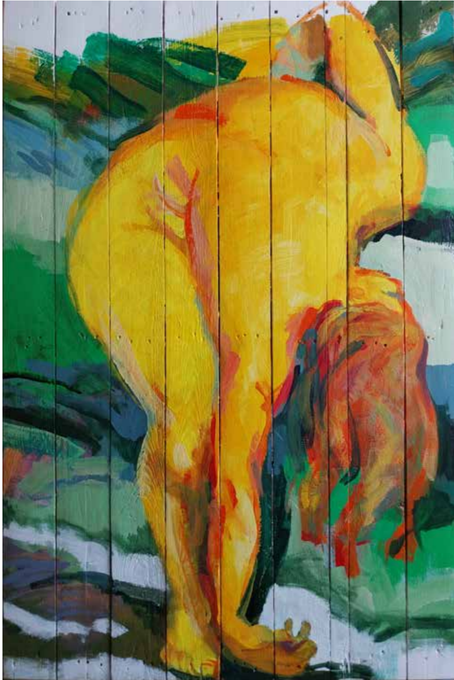
Détente, 2023, acrylique sur bois, 120 x 80 cm, 5 000 €